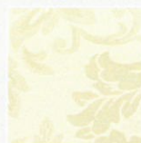
CH – champagner