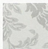
SI – silber