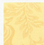
G – gold