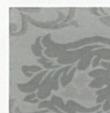
GP – graphit